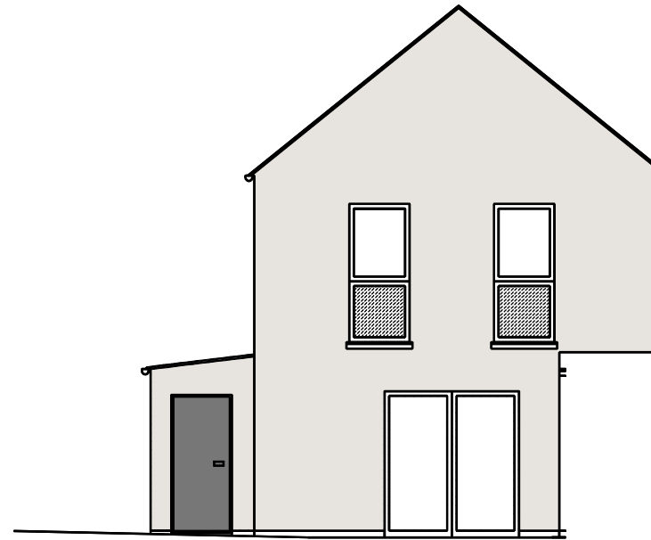
Façade Nord - M7