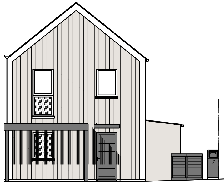
Façade Sud - M7