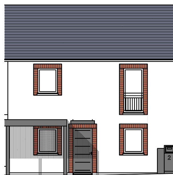
Façade Sud - M2