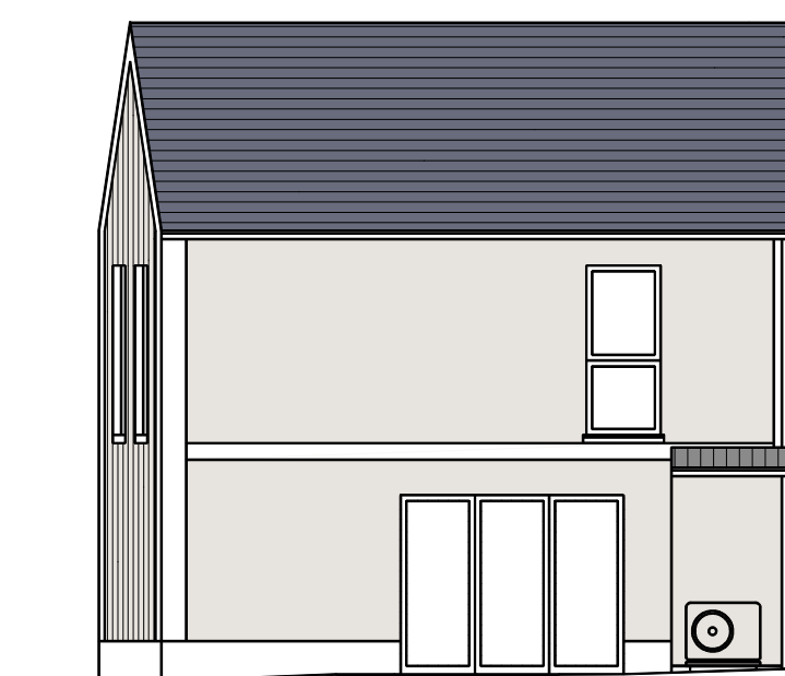
Façade Sud - M12