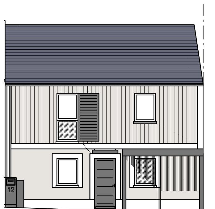
Façade Nord - M12