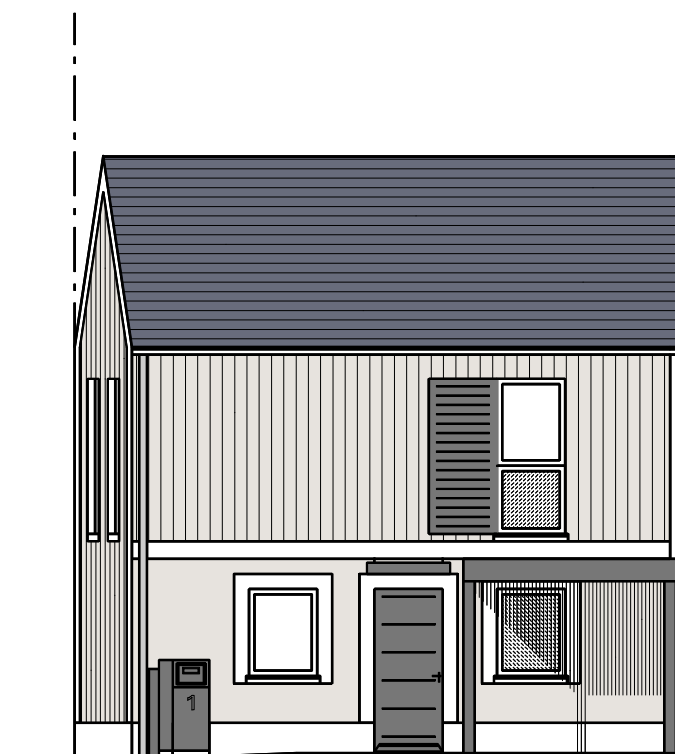
Façade Sud - M1