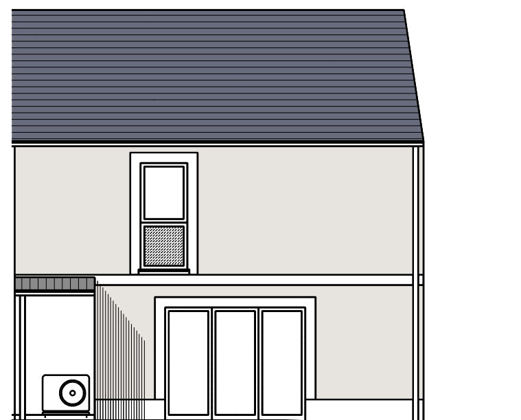
Façade Nord - M1